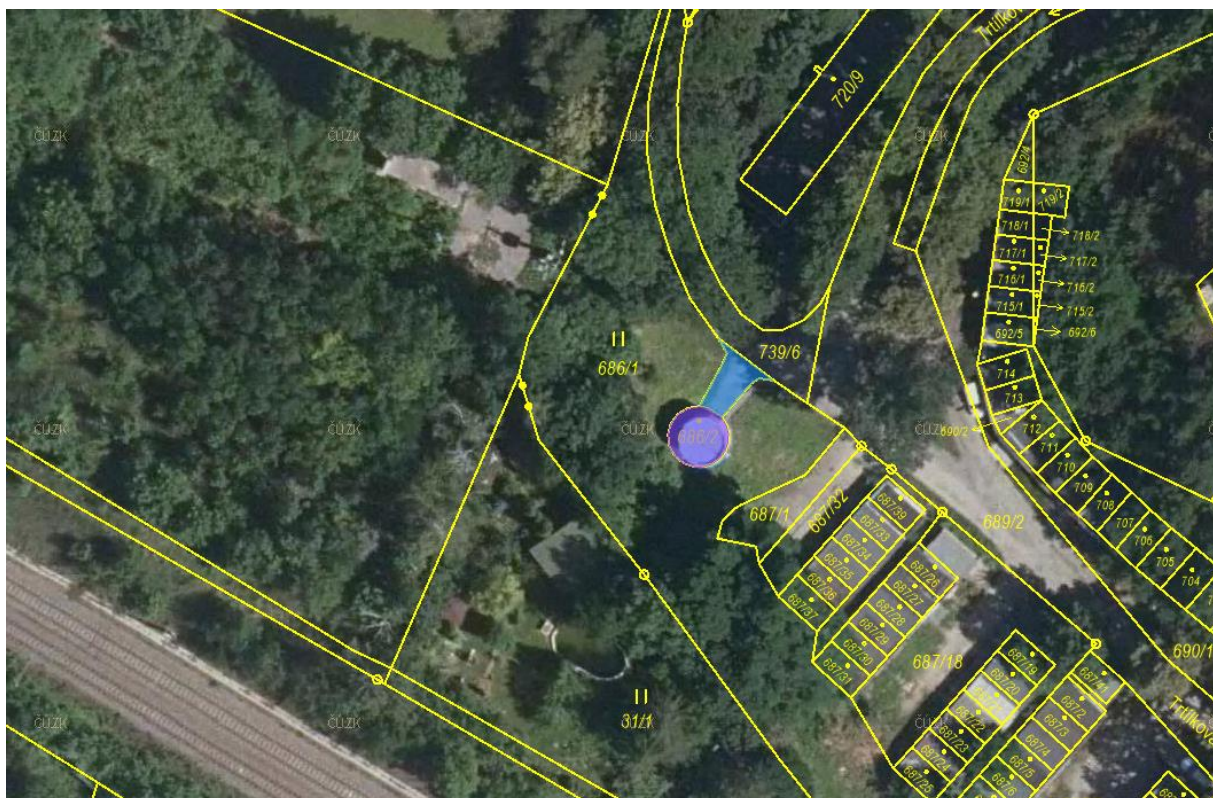
Obr. 5 Vyznačení objektu na katastrální mapě