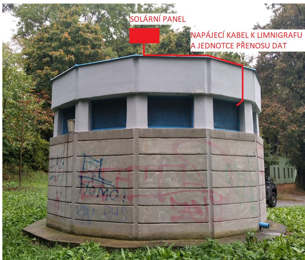
Obr. 2 Solární panel bude ukotven na střeše objektu vstupu do štoly. Z něj povede napájecí kabel po střeše budovy, prostoupí ocelovou mříží okna a dále povede na podlahu objektu, kde bude umístěn akumulátor elektrické energie a automatická jednotka pro přenos dat.