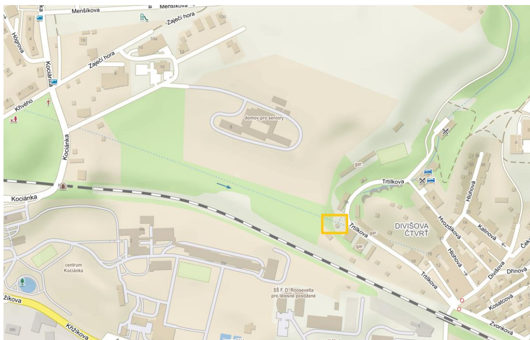
Obr. 1 Vyznačení objektu v širších vztazích